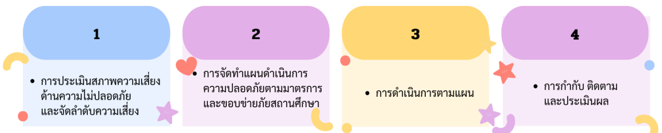
แผนผังที่ 2 การดำเนินการเสริมสร้างความปลอดภัยสถานศึกษา